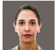
Por Laura Leticia Quirós Malagón

Estas Auditorías Ambientales se realizaron bajo los Primeros Términos de Referencia para la realización de Auditorías Ambientales, los cuales eran un documento cuyo objetivo era señalar las áreas que debían ser auditadas en una organización industrial, incluyendo aspectos de seguridad e higiene, que eran objeto de