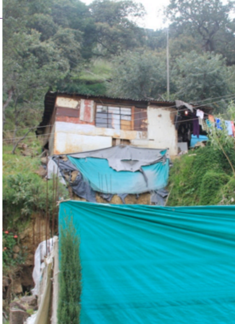
Asentamiento humano irregular ubicado en zona de riesgo y de alto valor ambiental, Delegación Xochimilco, 2013.

El esquema de planeación urbana se deriva del Plan Nacional de Desarrollo, el cual da pauta a la elaboración del Programa Nacional de Desarrollo Urbano y de ahí se deben alinear los